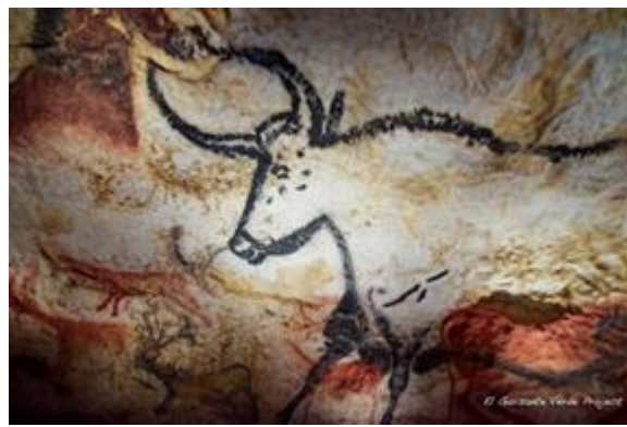
Ilustración 7: Cueva de Lascaux