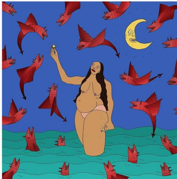
Ilustración 4: La revista Instyle

profesión y han dejado huella ya sea por su trabajo o por su visión innovadora de su área de trabajo; es el caso de la de la revista Instyle, en su artículo "17 ILUSTRADORAS FEMINISTAS QUE TE INSPIRARÁN HOY Y TODOS LOS DÍAS" que con ocasión de la celebración del día de la mujer decidió hacer una recopilación de ilustradoras a que utilizan su profesión para compartir la visión feminista que tienen de la misma y de su propio contexto.