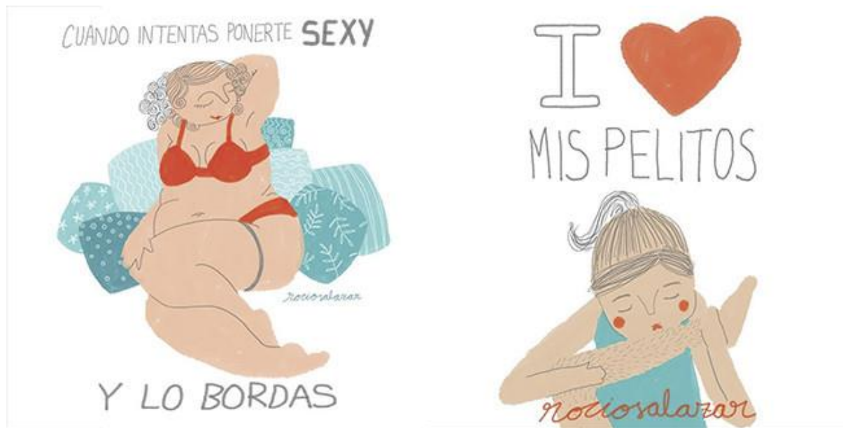
Ilustración 5: sitio web TENDENCIAS