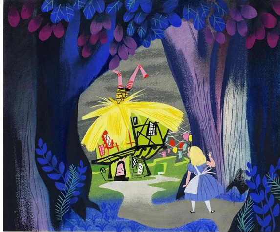
Ilustración 3: Libro infantil Alicia en el país de las maravillas, elaborado por Mary Blair

los estudios Disney; debido a esto desarrolló los concept art de Cenicienta, Alicia en el país de las maravillas y Peter Pan, entre otros.