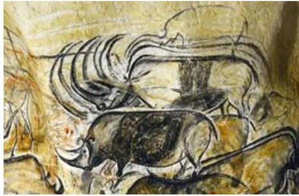
Ilustración 6: Cueva de Chauvet