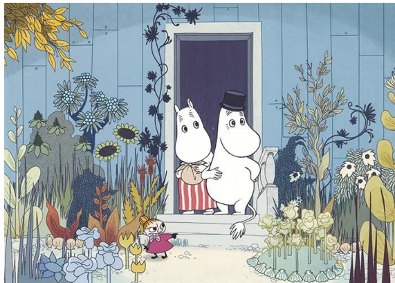
Ilustración 2: Libro infantil de Los Moomin, elaborado por Tove Jansson

Por otro lado tenemos a Tove Jansson (1914-2001) escritora, ilustradora, historietista y pintora finlandesa, su trabajo más reconocido fue el de la serie de los Moomin (1946) que tiene como protagonistas unas criaturas extrañas y simpáticas, con un humor tan universal que incluso hoy siguen vigentes, más de medio siglo después, sumado a esto en 1966 ganó el premio Christian Andersen.