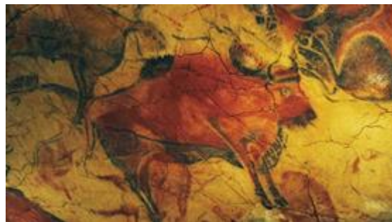
Ilustración 8: Cueva de Altamira

Aunque históricamente la forma predominante del uso de la ilustración ha sido en libros, revistas y periódicos también ha ganado un