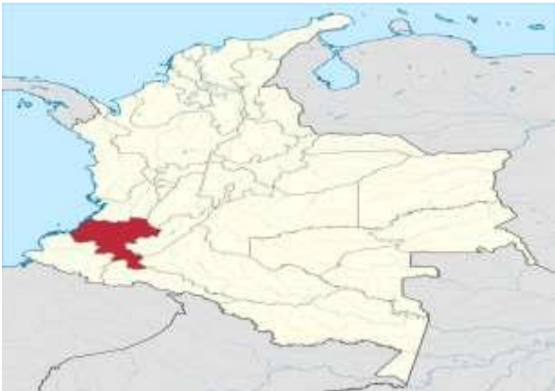
Figura 1 2 mapa de Colombia con visualización del departamento del cauca