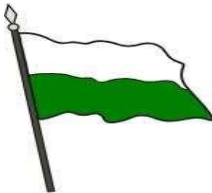
Figura 1 6. Bandera de Silvia

Se encuentra distribuida en dos franjas equitativas: una de color blanco y la otra de color verde.