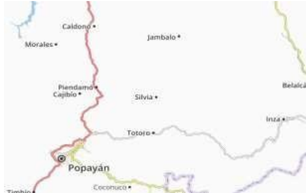
Figura 1 4. Ubicación municipio de Silvia con respecto a municipios aledaños