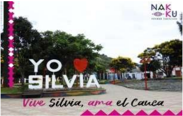
Figura 1 3 Silvia